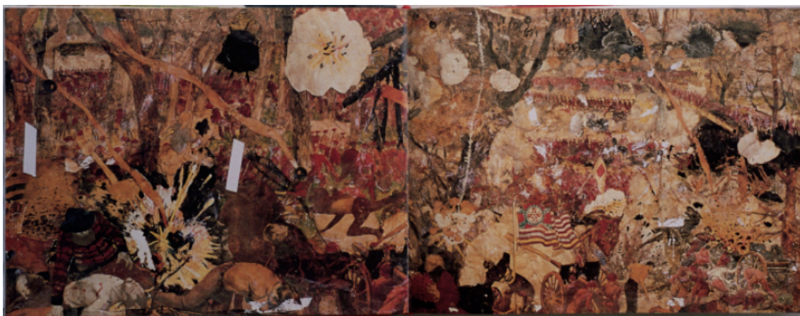
afb.12. detail The Battle of Calverhine